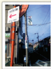
コスモス園の矢印看板