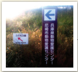
この看板が見えたら コスモス園はすぐそこ！